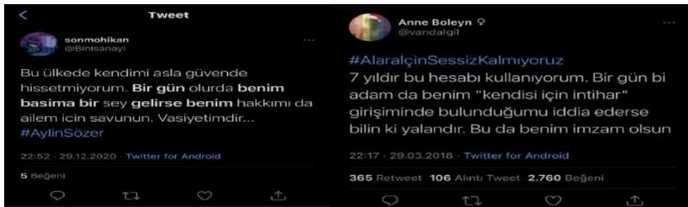
Görsel: Kadın cinayetleri sonrası atılan tweetler

1934 yılında seçme ve seçilme hakkı kazanan kadın birey 1975 yılına kadar sessiz bir şekilde yaşamaya devam etmiştir. Geçen bu süreçte dünyada kadınlar hakları için yürüyüşler düzenleyip durumun iyileştirilmesini talep etseler de Türkiye için aynı durum geçerli değildir. Kadınlar bir siyasal hak kazanmıştır ancak erkekler tarafından hala ciddiye alınmamakta ve Anadolu'da yaşayan hemcinsleri tarafından destek görmemektedir. Çünkü tarımla uğraşan ve eğitime zaman ayıramayan kadınlar ev işlerinin yükünü de omuzlarında taşımaktadır. Siyasete zaman bulamayan kadınlar için durum 1975 yılında Birleşmiş Milletler "Dünya Kadın Yılı" ilan edince değişiklik göstermiştir (Pekin+5, 2000).